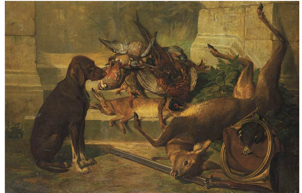
Illustration de couverture : Claudius Duty, Braque devant le trophée de chasse, lièvre, chevreuil, faisans, perdreaux, fusils et trompe de chasse. Huile sur toile, 112 × 170 cm.

Ordre de la Confrérie des Gastronomes du Puy-de-Dôme Hôtel des Associations 2, Boulevard Trudaine 63000 Clermont- Ferrand Tél. 06.79.09.38.53 www.gastronomes63.com